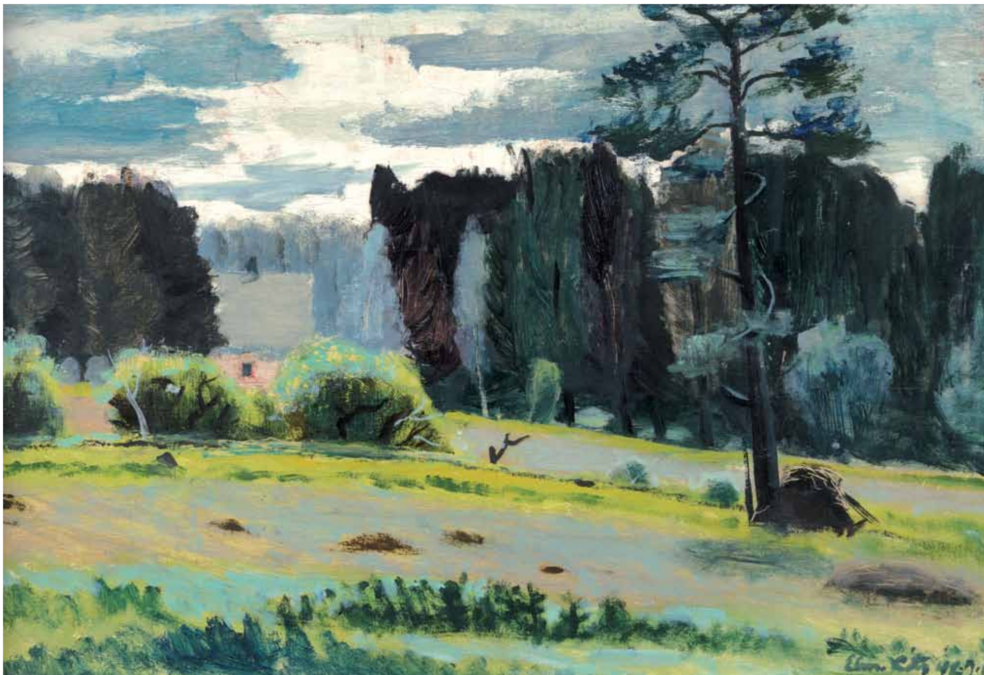
Valgemetsa motiiv Elmar Kits (1913-1972) 1942 Õli, vineer 38 x 48 cm

30-aastane Elmar Kits oli 1943. aastaks juba mitu aastat näitustel esinenud ning endale nime teinud ja mitmed tema tööd olid äratanud nii kriitikute kui ka muuseumite tähelepanu. 1940. aastal oli ta asunud "Pallase" õppejõuna tööle, kuid Saksa okupatsiooni ajal 1941-1944 töötas ta vabakutselise kunstnikuna, osaledes aktiivselt näitustel – ta oli neil aastatel viljakas, nimetatud kolme aasta jooksul valmis üle kolmekümne maali.