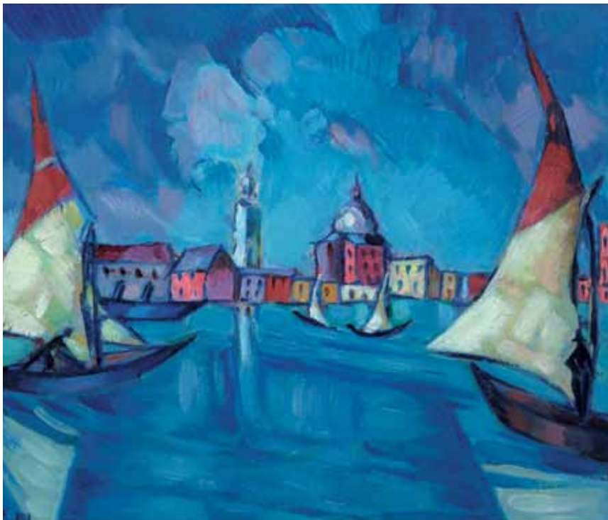
Konrad Mägi (1878-1925)