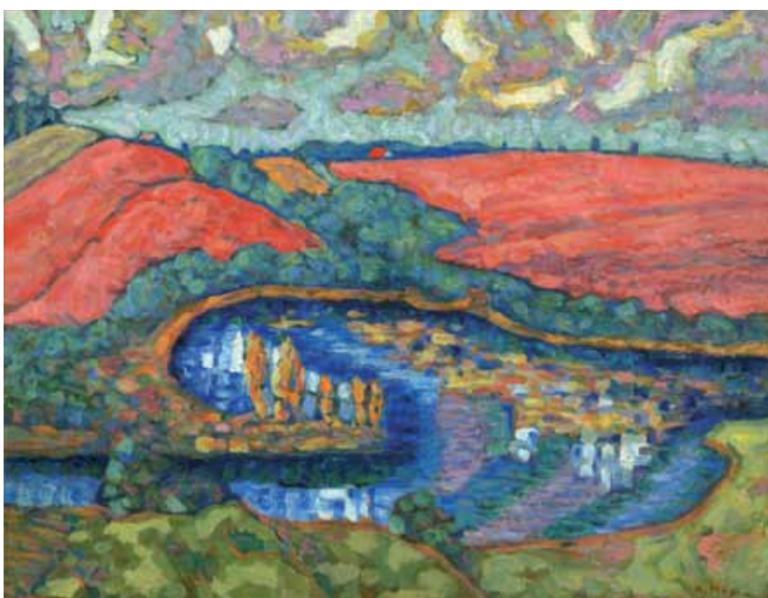
Konrad Mägi (1878-1925) Maastik roosade põldudega 1915-1916 Õli/lõuend 52 x 68 cm