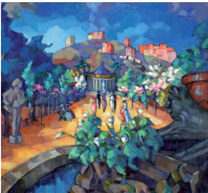
Konrad Mägi (1878-1925)

Veneetsia töödes kasutab Mägi tugevat kontuurjoont, värvipinnad on aga suured (näiteks Capri saare töödes on nad väikesed). Eraldi tasub märgata sügavsinise kasutamist. Kunstiajaloolaste sõnul oli Mägi jaoks see värv mitte ainult Veneetsias, vaid ka mujal oluline.