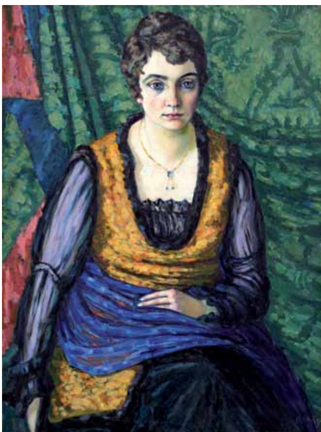
Konrad Mägi (1878-1925)

Maal “Itaalia maastik. Rooma” on formaadilt üks suuremaid selle perioodi teoseid. Lõuendilt on näha vormide muutumist nurgeliseks ning koloriidis ilmneb eriline intensiivsus. Selles on tajutav Konrad Mäe loomus ja elulugu – puunikerdajana alustanud kunstiõpilasest oli saanud maailmatasemel kunstnik. Töö puhul tasub tähele panna kompositsiooni ülesehitust. Mägi on keskmesse asetanud templilaadse ehitise, kuhu suunduvad daamid nii oma kaaslaste kui lastega. Seda ümbritsevad raamina purskkaev, kõrguvad hooned, puud ja põõsad ning skulptuur. Sel moel on ta justkui võtnud kokku linna olemuse, koondades ühte vaatesse iseloomulikud detailid.