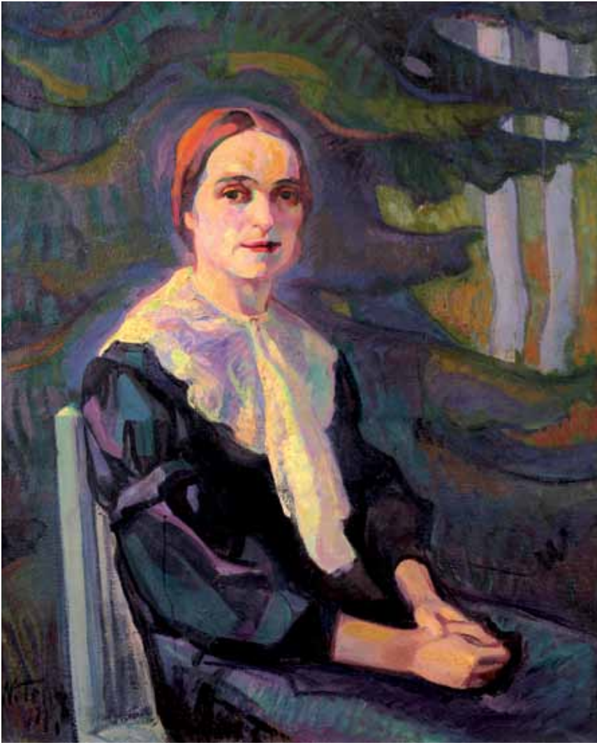
Nikolai Triik (1884-1940)