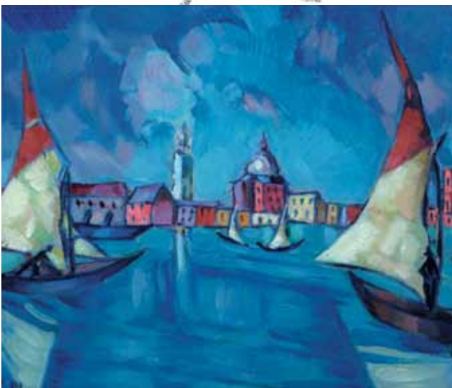
Konrad Mägi Veneetsia 1922-1923